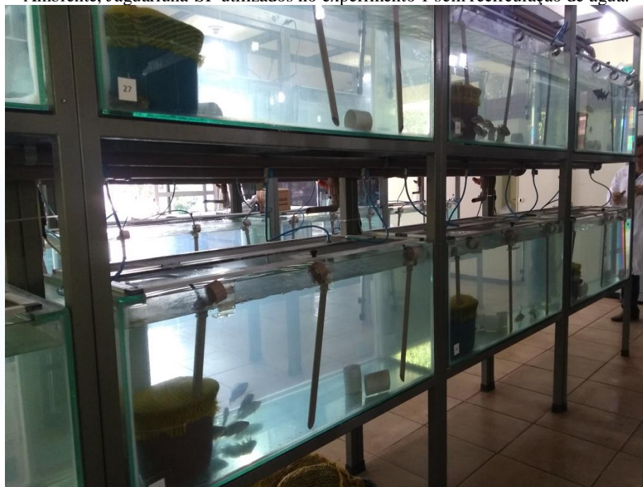
Figura 1- Sistema modular de aquários do Laboratório de Aquicultura e Ecotoxicologia da Embrapa Meio Ambiente, Jaguariúna-SP utilizados no experimento 1 sem recirculação de água.